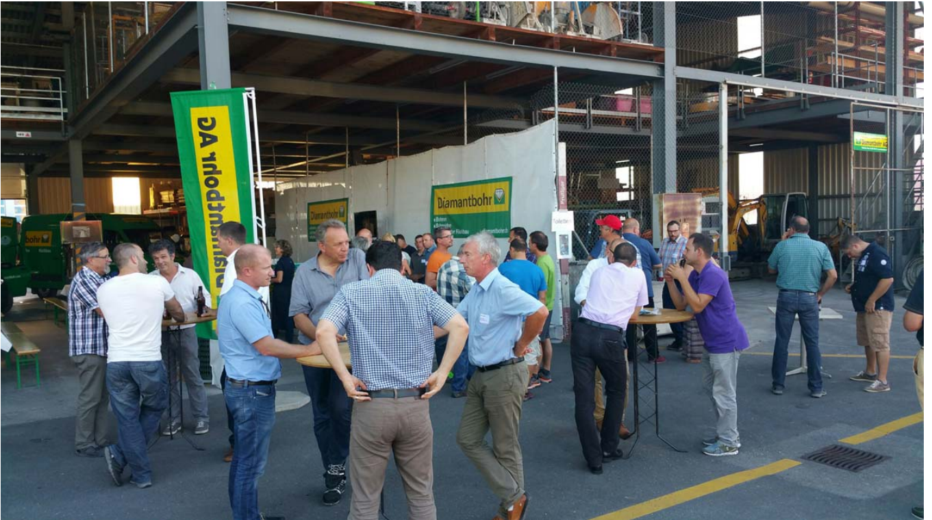
Interessante Gespräche werden geführt