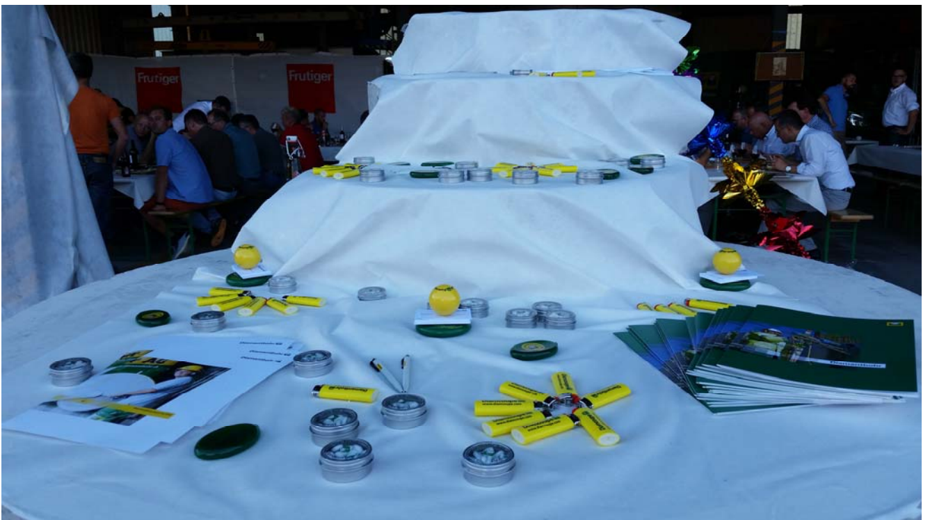
Infobroschüren und Gadgets