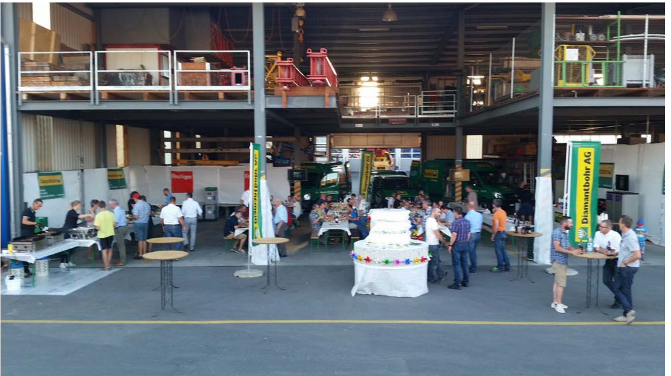
Apéro und Abendessen